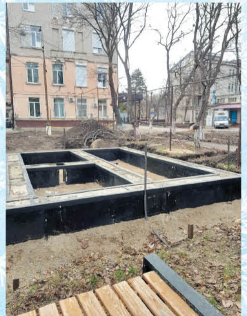
Подготовительные работы по установке новой трансформаторной подстанции