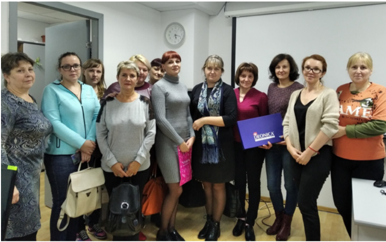
Обучение в торговой сети «Европа»