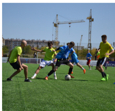
нования продлятся до июня 2020 года.

Спортсмены сборной сыграли двенадцать матчей, в одиннадцати из которых одержали победу, а один завершили вничью. Тринадцатая игра команды состоится уже в этом году. Всего в чемпионате Невинномысска по футболу среди любительских команд «Арнест футбольная лига» принимают участие 28 коллективов, разделённых на две подгруппы по 14 команд. После окончания второго круга будут определены 8 лучших команд в каждой подгруппе, которые в серии плей-офф разыграют между собой первенство в лиге. Соревнования продлятся до июня 2020 года.