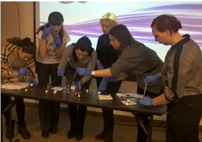
Мастер-класс по созданию аромата диффузора для дома

друг с другом опытом и получить обратную связь от профессионала. Мероприятие отлично повлияло на создание положительного имиджа ОАО «Компания «Арнест».