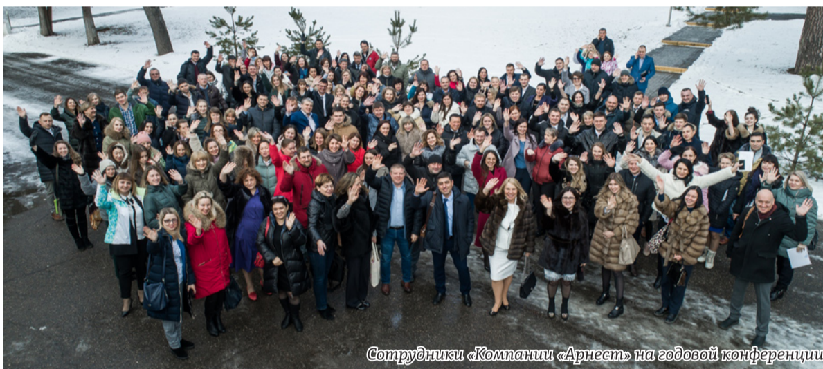
Сотрудники «Компании «Арнест» на годовой конференции