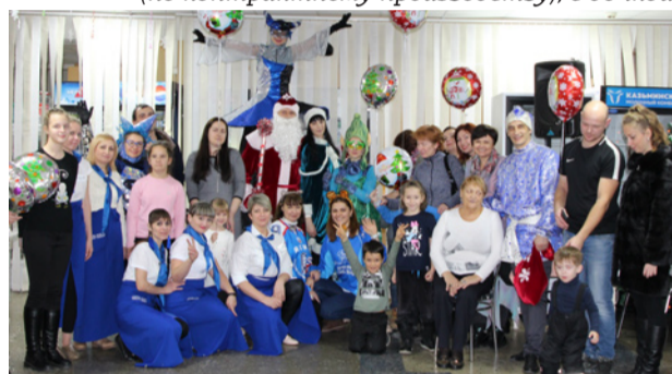
Участники и организаторы мероприятия

21 декабря первичная профсоюзная организация «Арнест» при поддержке АО «Арнест» организовала праздничное мероприятие для детей и внуков сотрудников предприятия. Ребята вместе со взрослыми посетили резиденцию Деда Мороза в ООО «Арнест-Сервис», где получили подарки из рук зимнего волшебника и весело провели время.