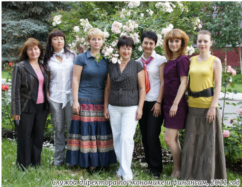
Служба директора по экономике и финансам, 2011 год

Коллектив службы директора по экономике и финансам