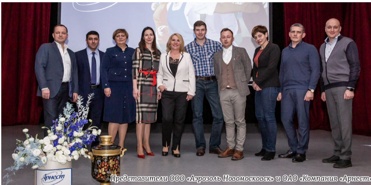
Представители ООО «Аэрозоль Новомосковск» и ОАО «Компания «Арнест»