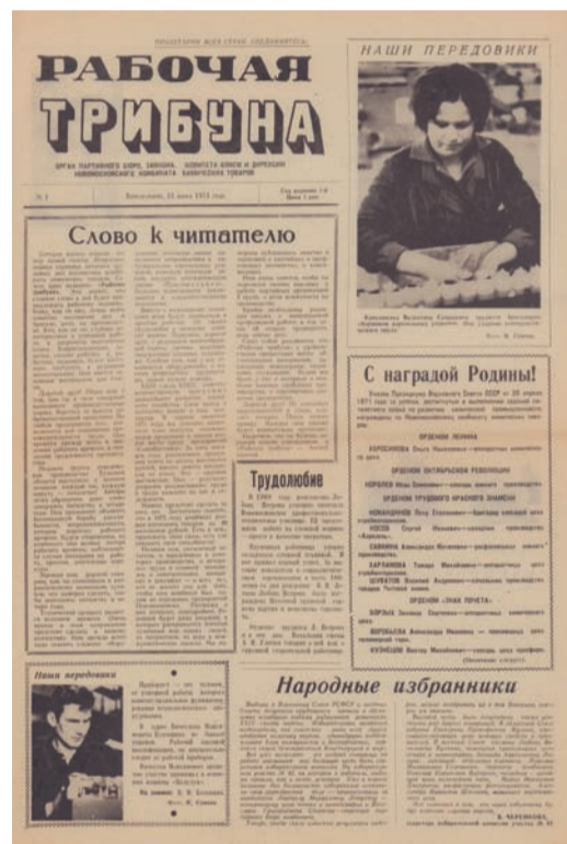
Газета «Рабочая трибуна», №1 от 21 июня 1971 года