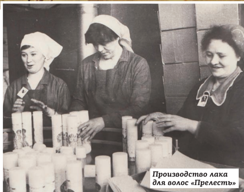
Производство лака для волос «Прелесть»

В первом номере многотиражной газеты «Рабочая трибуна» много писалось о трудолюбии работников, о техническом прогрессе, о необходимости осваивать сложное оборудование, поточные линии наполнения аэрозольных упаковок, совершенствовать технологии. Сами заводчане на страницах газет призывали своих товарищей проявлять трудолюбие и смекалку при выполнении производственных заданий. Будучи современным и технически передовым предприятием для своего времени, ООО «Аэрозоль Новомосковск» продолжает оставаться таковым и в XXI веке, что требует больших усилий со стороны работников всех подразделений завода.