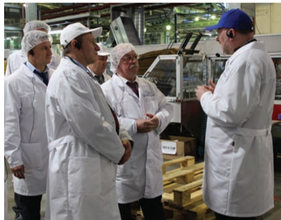
Экскурсия по цеху наполнения