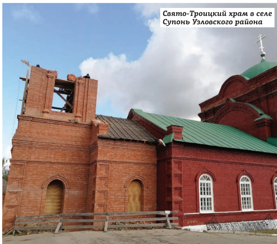
Свято-Троицкий храм в селе Супонь Узловского района

Осенью 2019 года ООО «Арнест МеталлПак» оказало помощь в строительстве колокольни Свято-Троицкого храма в селе Супонь Узловского района Тульской области. Предприятие активно взаимодействует с администрацией города Узловая в различных направлениях деятельности.