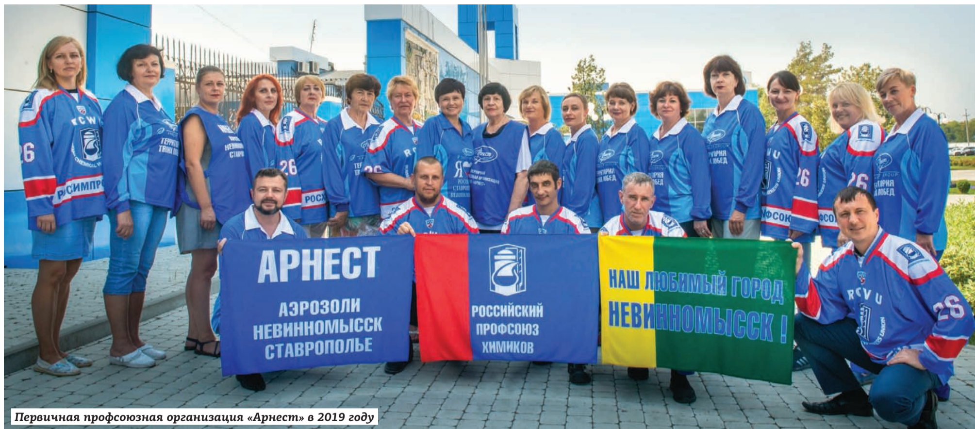
Первичная профсоюзная организация «Арнест» в 2019 году

28 ноября первичная профсоюзная организация «Арнест» отметила полувековой юбилей со дня создания организации. История профсоюза тесно связана с историей предприятия.