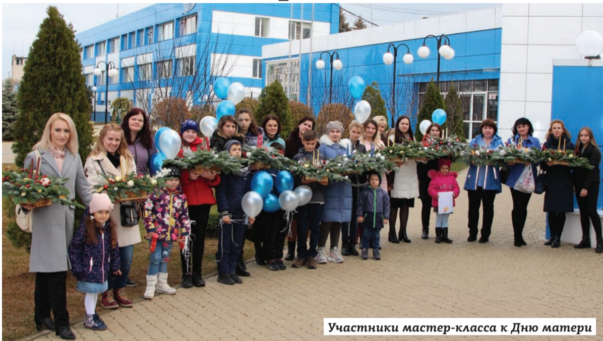
Участники мастер-класса к Дню матери

30 ноября в АО «Арнест» прошёл мастер-класс по созданию новогодних интерьерных композиций, посвященный Дню матери. Мероприятие организовал профсоюзный комитет при поддержке администрации завода с привлечением профессиональных флористов цветочного центра «Флора Парк». Формат корпоративного семейного мастер-класса подарил возможность в выходной день работающим мамам уделить время детям и пообщаться с коллегами в неформальной обстановке.