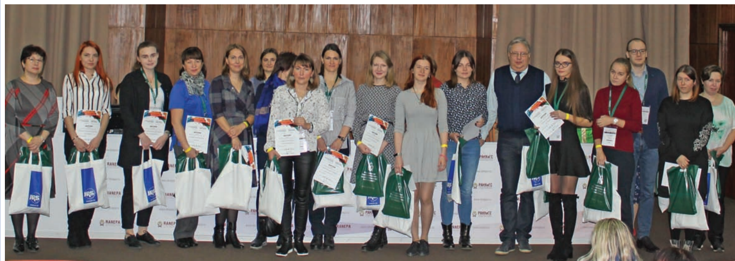
Награждение победителей и участников конкурса «Лучший технолог»