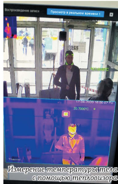
Измерение температуры тела с помощью тепловизора

Руководство АО «Арнест» призывает работников предприятия,