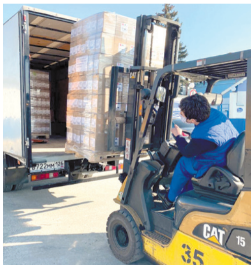
Отгрузка дезинфекторов на благотворительные цели