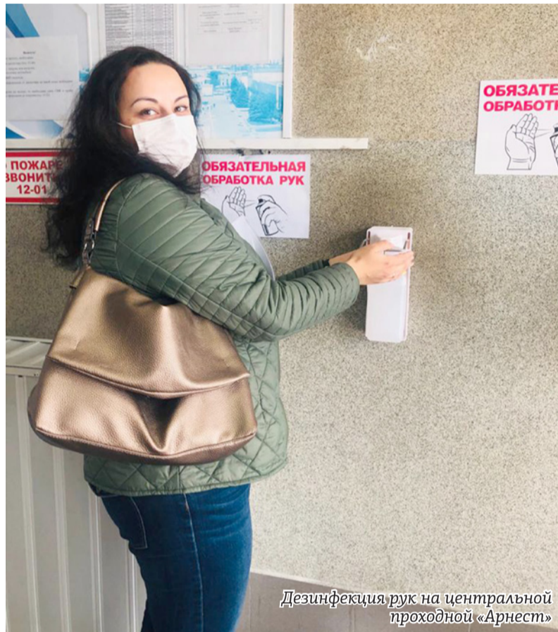
Дезинфекция рук на центральной проходной «Арнест»