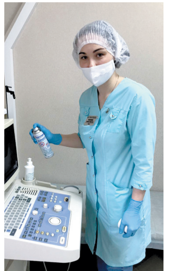
Использование дезинфекторов в больнице