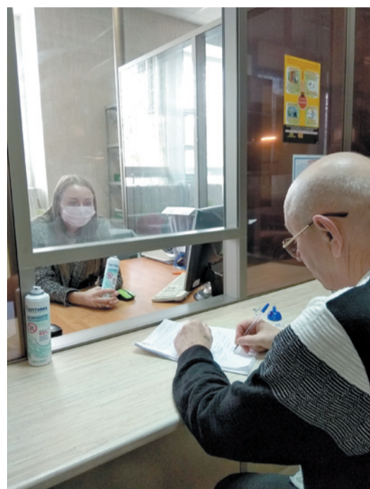
Обслуживание населения в комитете по труду и соцподдержке

Благотворительная помощь от АО «Арнест» оказана самым разным структурам Ставропольского края, нуждающимся в поддержке. Среди них медицинские, образовательные, социальные учреждения, государственные структуры и ведомства, Пятигорская и Черкесская епархия. АО «Арнест» передало аэрозольные дезинфекторы комитету по труду и социальной поддержке населения администрации Невинномысска с целью профилактики коронавирусной инфекции при многочисленных контактах сотрудников с гражданами. «От всей души благодарим коллектив предприятия и лично президента АО «Арнест» Алексея Сагалу за оказанную поддержку. В условиях дефицита дезинфицирующих средств – это поистине вовремя протянутая рука помощи», – написали в благодарственном письме соцслужбам.