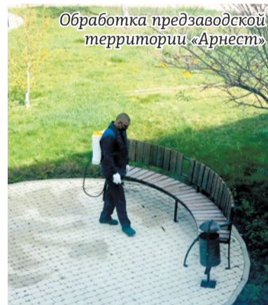
Обработка предзаводской территории «Арнест»

С целью обеспечения трудовой деятельности сотрудников ОАО «Компания «Арнест», выполнения планов продаж и прибыли руководством компании были приняты меры по перестройке рабочих процессов в отделах и департаментах. Сотрудники продолжили работать в прежнем режиме, обеспечивая потребителей продукцией и товарами первой необходимости: антисептиками, дезинфекторами, детскими шампунями.