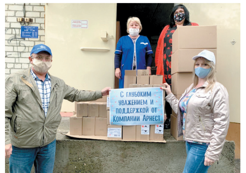
Сотрудники «Компании «Арнест» доставили гуманитарную помощь в горбольницу