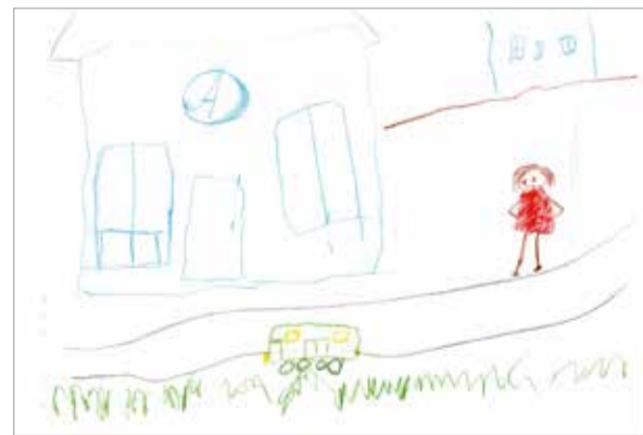
Даниил Тишкин, 4 года