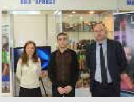
«Круглые столы», показ мод и конкурс дизайнеров. Подводя итоги состоявшейся выставки, глава края отметил, что по-добные мероприятия являются лишним подтверждением статуса Ставро-полья, как промышленного края.

Продемонстрировать продукцию легкой, текстильной промышленности и потребительского сектора смогли одновременно более пятидесяти предприятий-участников, среди которых ОАО «Арнест» было заявлено как одно из крупнейших в крае. Крупнейшее аэрозольное предприятие представило внимание участников и гостей выставки лучшие образцы косметической продукции и средств по уходу за домом. Также на выставке были представлены инновационные технологии и оборудование. Дополнительно в рамках мероприятия состоялись тематические