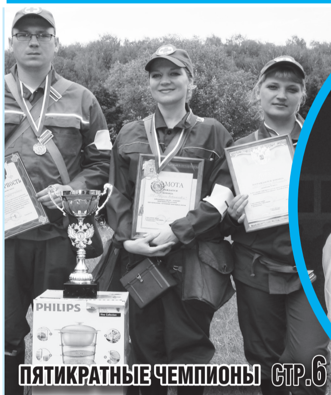
ПЯТИКРАТНЫЕ ЧЕМПИОНЫ СТР.6