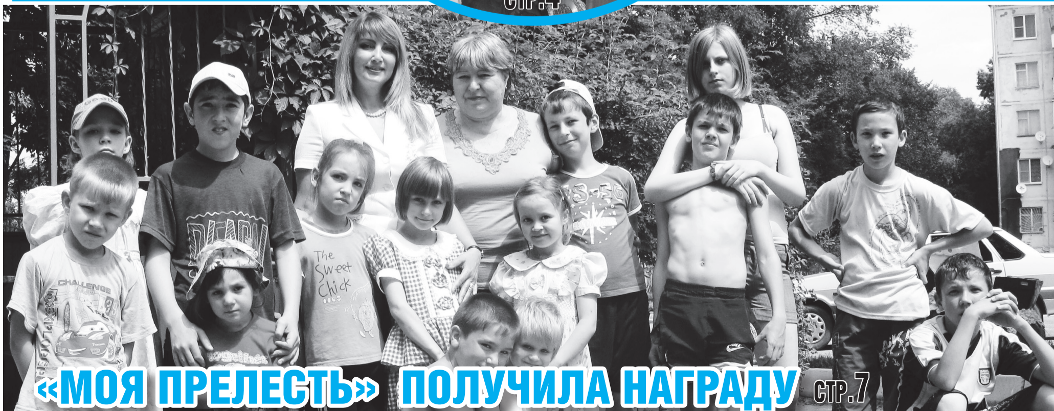
«МОЯ ПРЕЛЕСТЬ» ПОЛУЧИЛА НАГРАДУ СТР.7