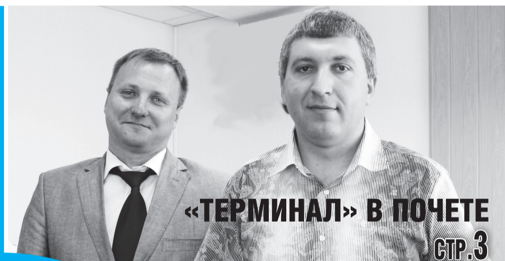
«ТЕРМИНАЛ» В ПОЧЕТЕ СТР.3