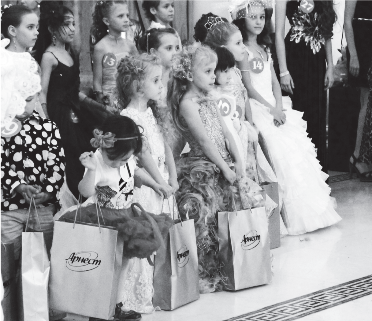
Маленькие принцессы СКФО.

в санатории «Pontos Plaza». Со всех уголков Кавказа съехались маленькие звезды в сопровождении своих родителей, чтобы принять участие в конкурсе и показать свои наряды и творческие возможности. Укладки и прически участникам делались при помощи средств для стайлинга «Прелесть Professional», что помогло им быть уверенным в своей привлекательности на протяжении всего конкурса. Они пели, плясали,