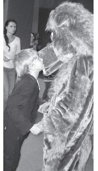
Нам не страшен серый волк!

Праздник продолжился спортивными играми-конкурсами, где каждый мог проверить свою меткость в дартсе, футболе, баскет-