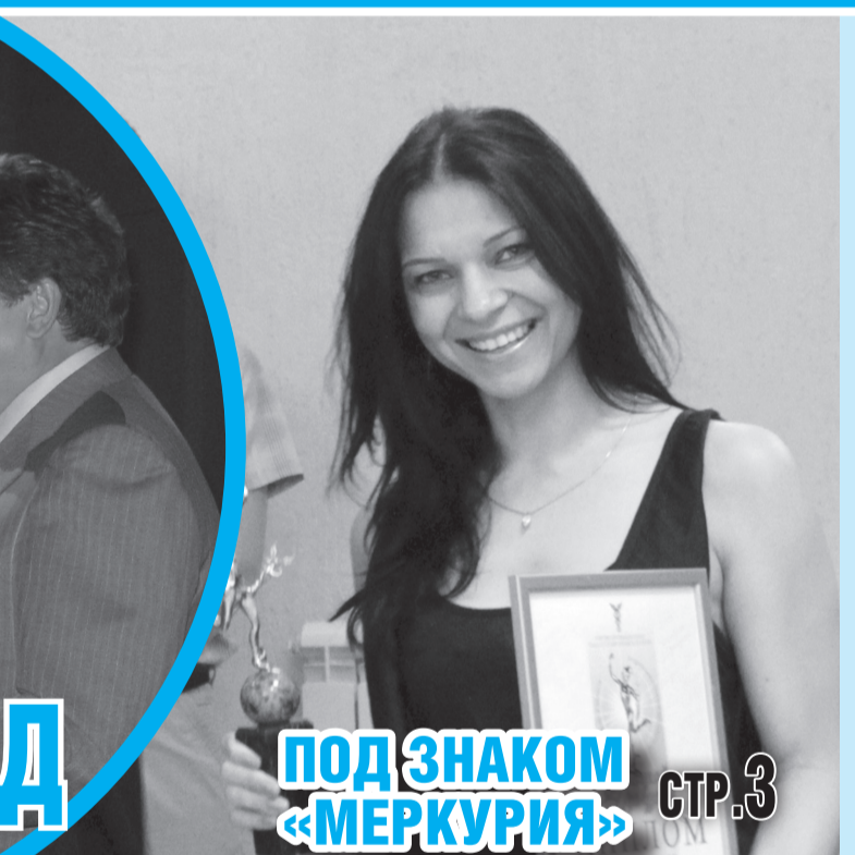
ПОД ЗНАКОМ «МЕРКУРИЯ» СТР.3