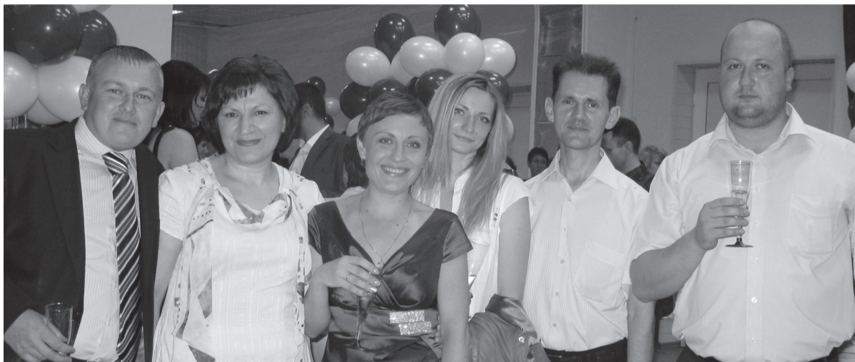
На банкете в честь Дня химика царил праздничное настроение. Торжество прошло на славу, что видно по радостным лицам участников вечера

В канун профессионального праздника – Дня Химика – в Невинномысском Дворце культуры им. М. Горького состоялось торжественное собрание коллектива ОАО «Арнест», на котором более восьмидесяти лучших работников получили награды.