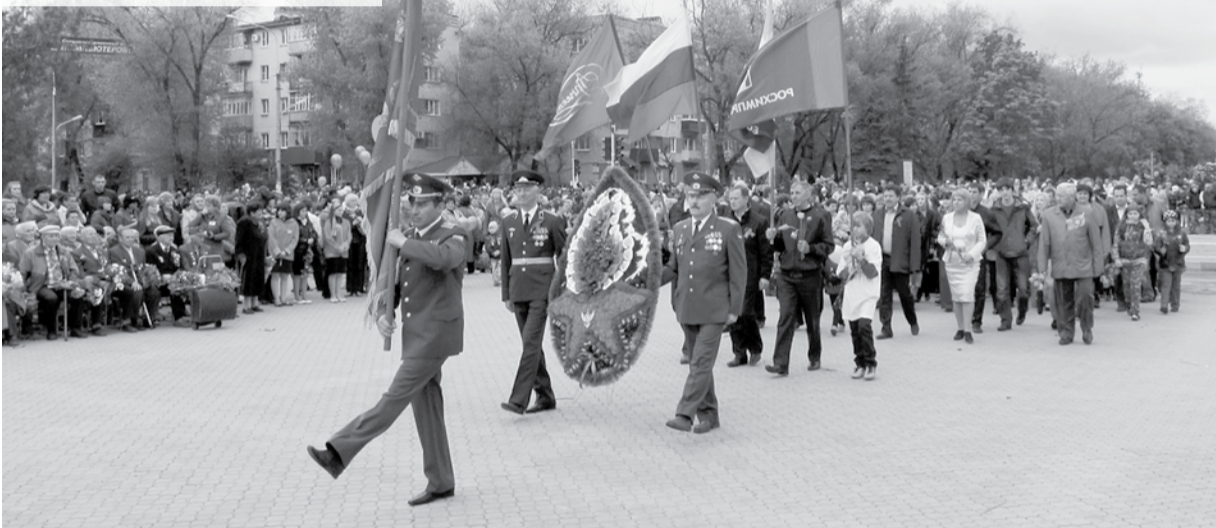
Колонна ОАО «Арнест»

День Победы - самый почитаемый праздник в России. Победа в Великой Отечественной войне - предмет нашей особой гордости, а 1945 год - символ величия нашей страны. Как бы ни меняли