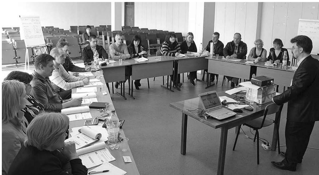
Сотрудники ООО «Аэрозоль Новомосковск» слушают тренинг «Управление издержками»

Кроме того, тренинг позволил сотрудникам разных служб, работая с финансами, найти общий язык, помог услышать друг друга и задать направление совместной работы.