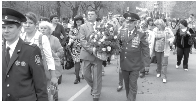
Колонна ООО «Аэрозоль Новомосковск»

за последние годы факты нашей истории, 9 мая остается неизменным, всеми любимым, дорогим, скорбным, но в тоже время и светлым праздником. Мы по-прежнему помним, какой ценой