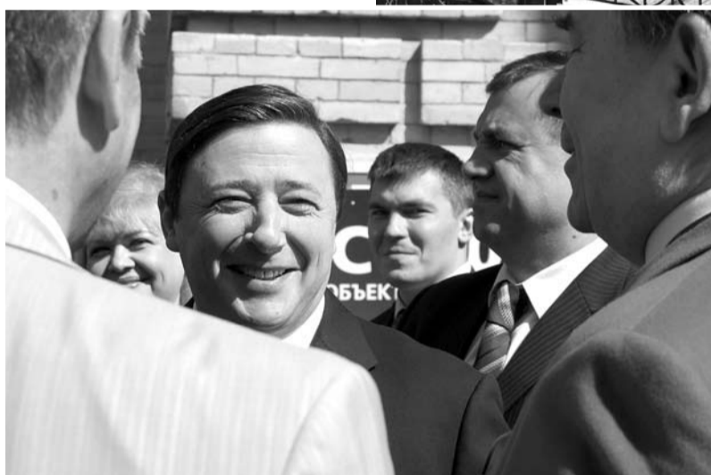
Александра Хлопонина встречают делегаты форума

Работу форума открыл полномочный представитель Президента РФ в СКФО, вице-премьер Александр Хлопонин: - Я возлагаю очень большие надежды на форум «Кавказская здравница». Рассчитываю, что и сегодня, и в дальнейшем он будет той дискуссионной площадкой, на которой мы могли бы выработать интересные, содержательные предложения, которые войдут составной частью в государственную целевую программу развития Северного Кавказа, включающую в себя продвижение местных курортов, туризма, экологически чистой продукции. На уровне Правительства Российской Федерации мы поддерживаем форум и будем стремиться к тому, чтобы с каждым годом он прогрессировал, набирал обороты.