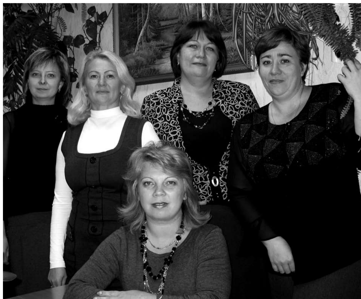
Сотрудники сектора учета ТМЦ, производственных затрат и реализации