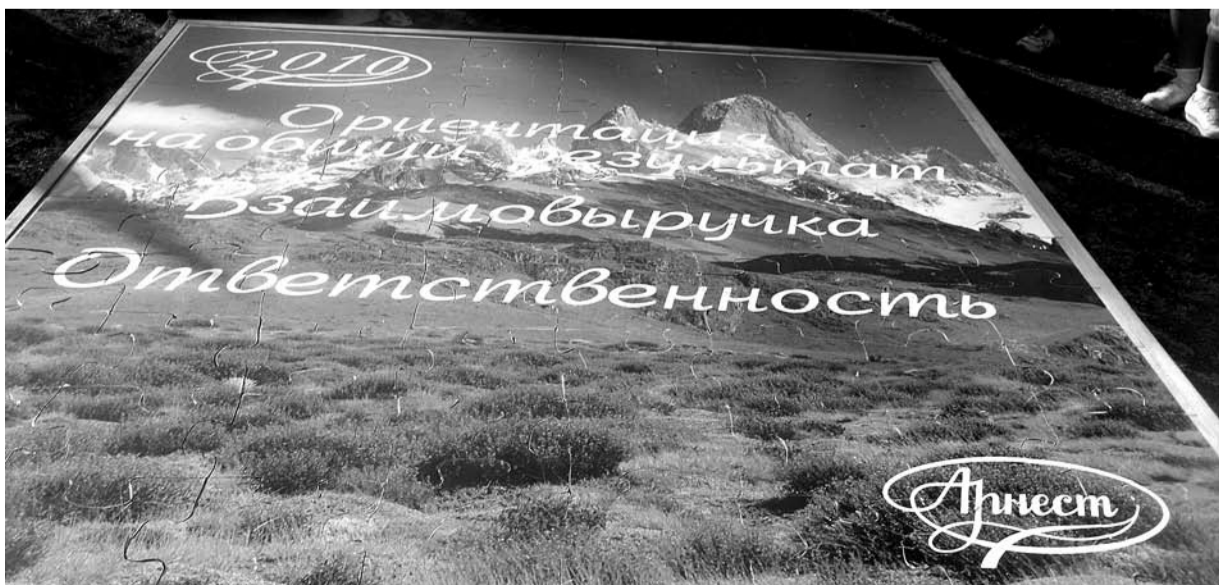
Пазл, собранный участниками игры