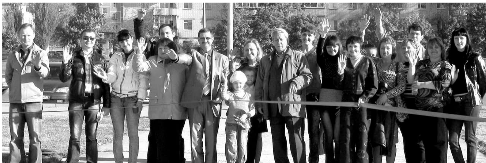
Дружная команда арнестовцев открывает аллею кленов

Аллея кленов зеленеет. Возможно, через 20 лет кто-то из нас или наших детей посидит в тени ее раскидистых кленов.