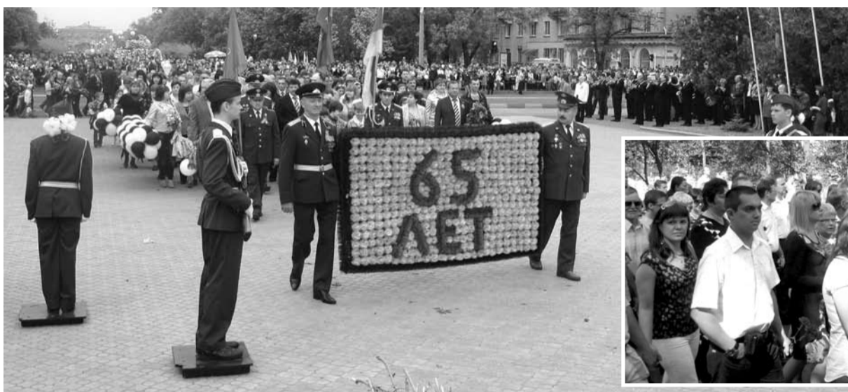
Шествуют колонны ОАО «Арнест» и ООО «Аэрозоль Новомосковск»