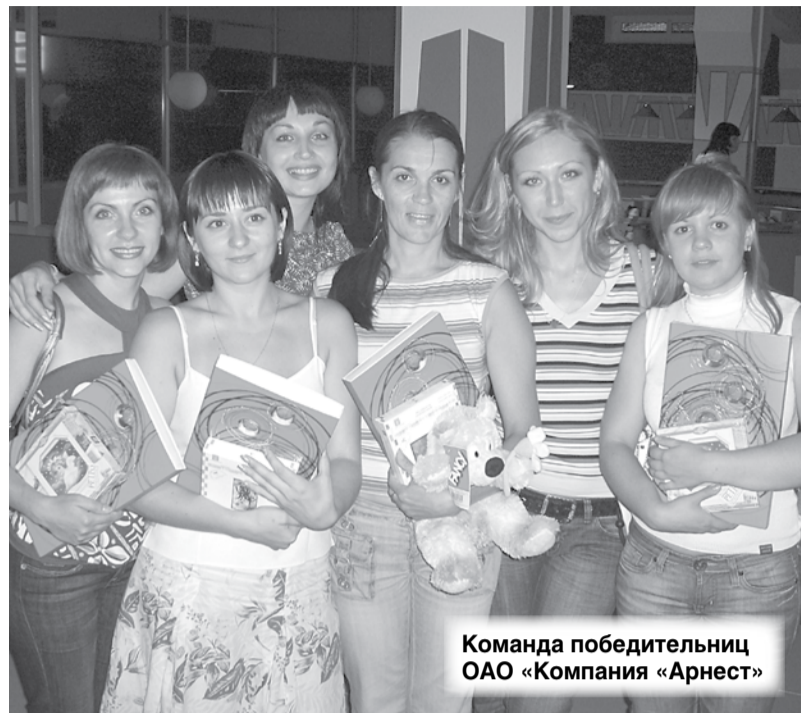
Команда победительниц ОАО «Компания «Арнест»