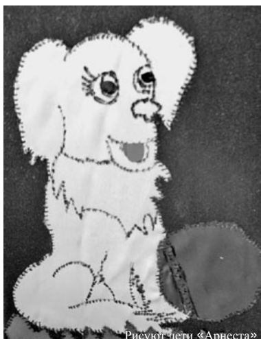
Рисуют дети «Арнеста»

В младшей возрастной группе первое место заняла аппликация Алины Ткаченко