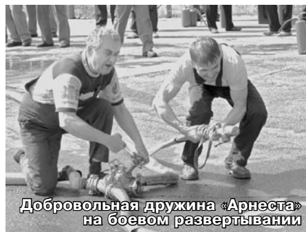
Добровольная дружина «Арнест» на боевом развертывании

Соревнования имеют огромное значение для нашего предприятия, ведь их участники – не профессиональные пожарные, но именно они окажутся первыми