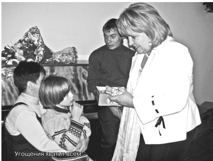
Угощения хватит всем.