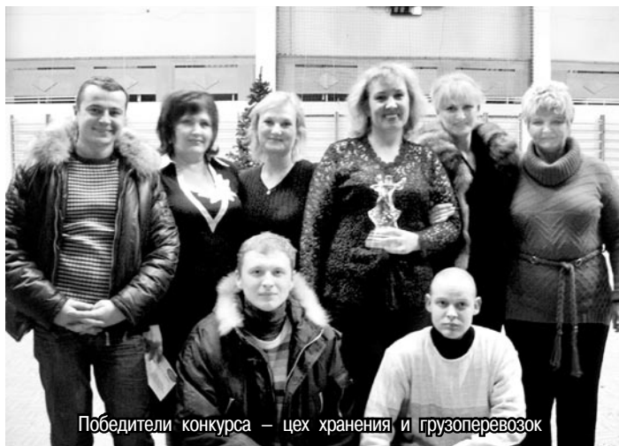
Победители конкурса – цех хранения и грузоперевозок

Самое трудное – открывать выступление. Но артисты цеха наполнения, выступавшие первыми, уверенно преодолели волнение первых минут. Открытием стало исполнение песни