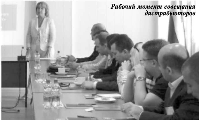
Рабочий момент совещания дистрибьюторов

составил 1090 млн. руб., что на 161 млн. руб. (-13%) ниже задания бизнес-плана. На выполнение задания бизнес-плана отрицательно повлияли, во-первых, отставание по объему производства в натуральном выражении и, во-вторых, снижение средней цены на 0,76 руб. в связи со структурным сдвигом в ассортименте (значительно увеличился удельный вес инсектицидов и снизился удельный вес контрактной продукции и средств по уходу за волосами). По сравнению с соответствующим периодом прошлого года объем товарной продукции снизился на 5%. Снижение произошло за счет уменьшения на 12% объемов производства продукции контрактного производства и на 36% объемов производства полуфабрикатов на сторону.