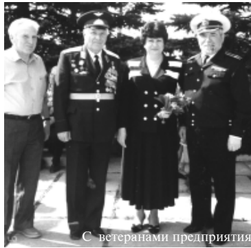
С ветеранами предприятия

потеряли надежду на санаторно-курортное оздоровление. В ОАО «Арнест» администрация и профсоюзный комитет договорились об оздоровлении работ-