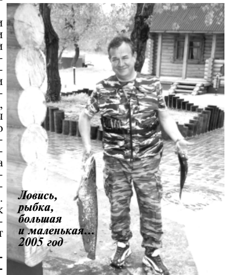
Ловись, рыбка, большая и маленькая... 2005 год

- Однажды мне попались стихи, которые надолго запали в душу. Они точно определяют смысл моей жизни, и я хочу, чтобы и дети мои, и внуки видели в них главную линию своей жизни: